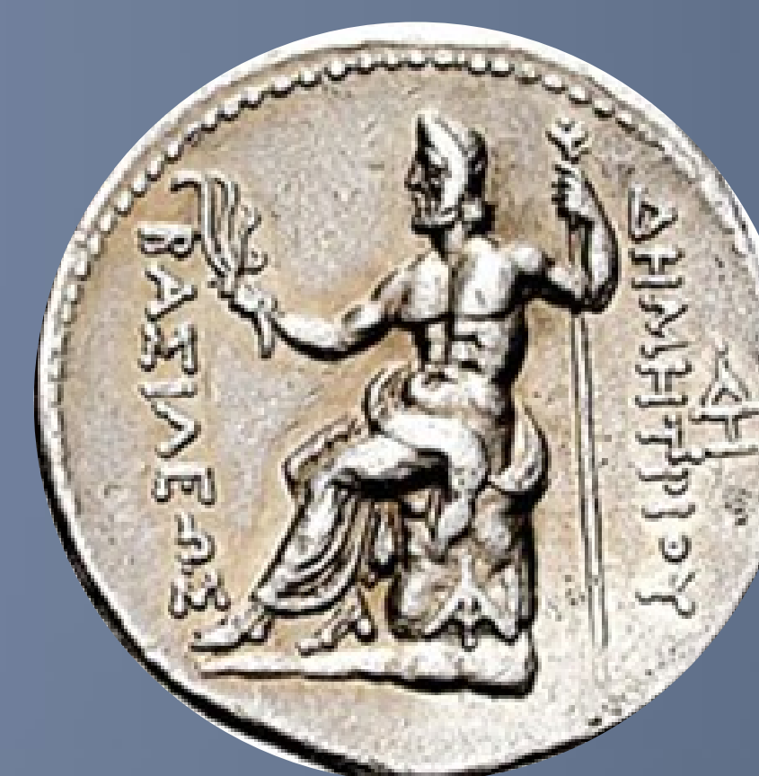
Macedonia. Demetrios I Poliorcetes. 306-283 a.C. Tetradracma de plata. Ceca de Pella. Circa 292-291 a.C. Anverso: cabeza del rey Demetrio diademada y tocada con cuernos de toro. Reverso: Posidón sentado en una roca, hacia la izquierda. Con cetro y aplustrum