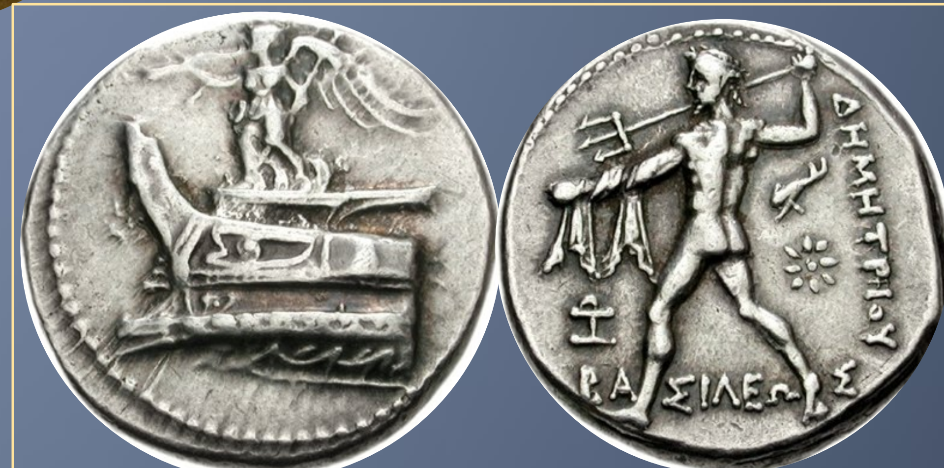
Demetrios I Poliorcetes. 306-283 a.C. Tetradracma de plata . Ceca de Pella. Anverso : Niké sobre el castillo de proa de un barco hacia la izquierda, sosteniendo trompeta en su mano derecha y banderola en la izquierda. Reverso: Posidón empujando su tridente en posición retrógrada. Delfín sobre estrella, monograma y leyenda: Basileos Demetriou .

En diversos puntos de Grecia, la cabeza barbada y coronada del dios (semejante a Zeus), de acuerdo con el prototipo helenístico más característico, ocupa el anverso de las monedas. Tanto en piezas de la Liga Beocia como en Byzantium, el dios marino aparece asociado a Demeter, con quien había tenido una unión amorosa muy conocida; es habitual que la diosa de la tierra ocupe el anverso y el dios marino (estante o sedente), el reverso.