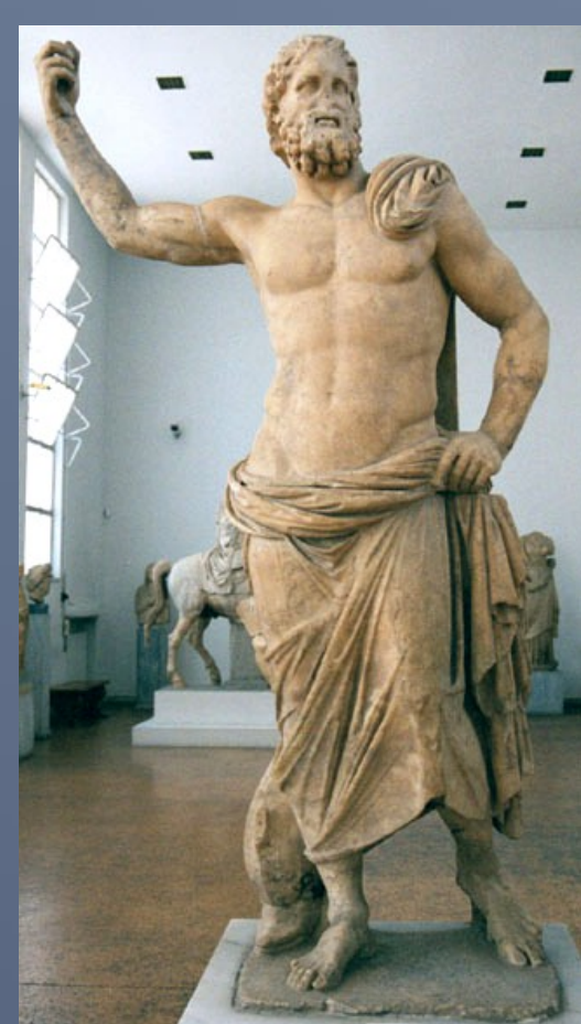
Posidón de Melos. S. IV a.C. Atenas, Museo Arqueológico Nacional

En el siglo IV se impusieron varios prototipos monetales nuevos, también en estrecha relación con la escultura monumental; merecen citarse, en este punto, el Posidón de Eleusis y el Posidón de Melos, obras que marcan el camino hacia el arte helenístico, con su acentuado naturalismo: sus imágenes son evocadas casi al pie de la letra en las monedas. En el reino de Macedonia, Demetrios Poliorcetes utiliza una efigie del dios análoga a la conocida desde los primeros cuños de Posidonia en el reverso, mientras que en el anverso puede aparecer la imagen del rey, deificado (con cuernos de toro), o una Nike montada en el castillo de proa de una embarcación, haciendo sonar su salpinx , para anunciar el triunfo naval. En otros casos, el dios aparece sedente, sobre una roca y sosteniendo en la mano un "aplustrum".