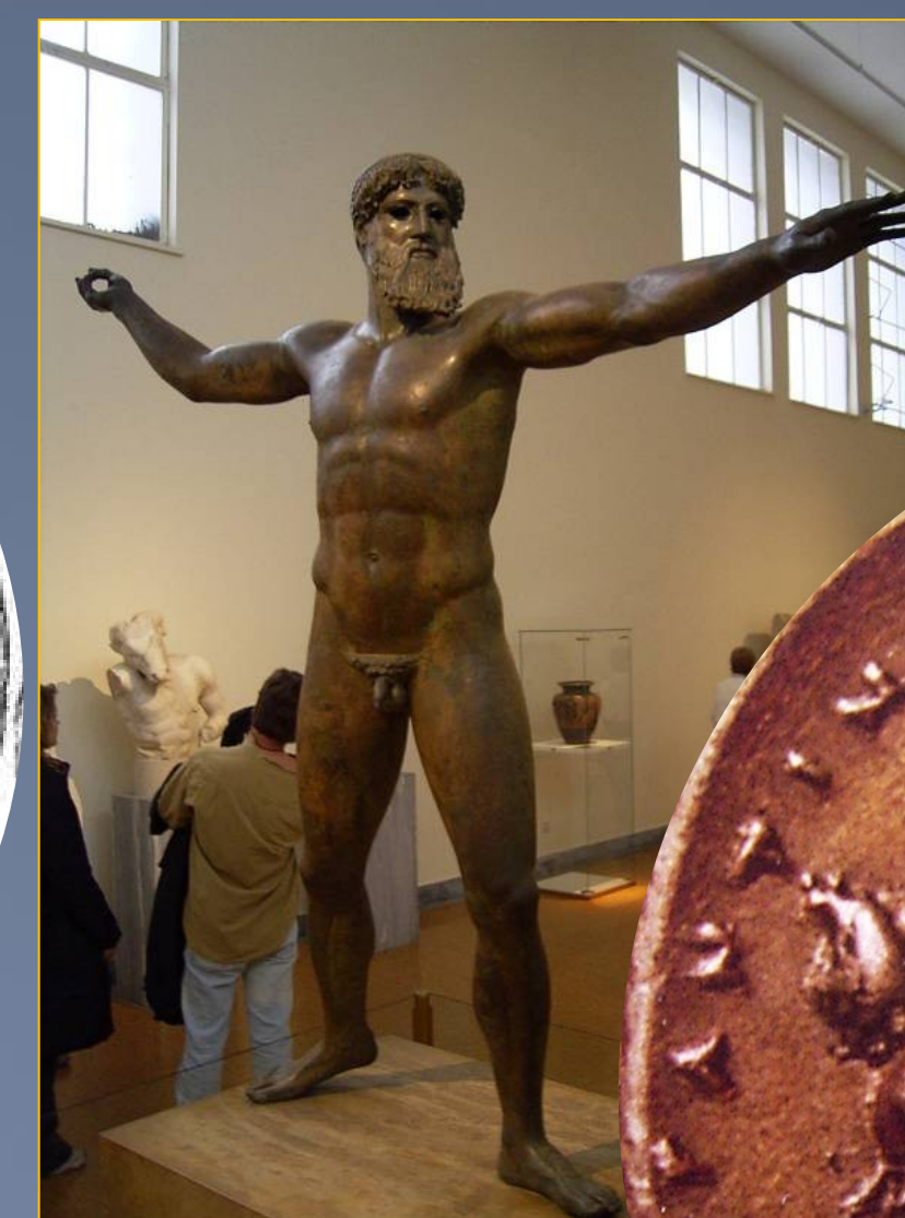
Posidón (o Zeus) de Artemisión. Circa 460 a.C. Museo Nacional de Atenas