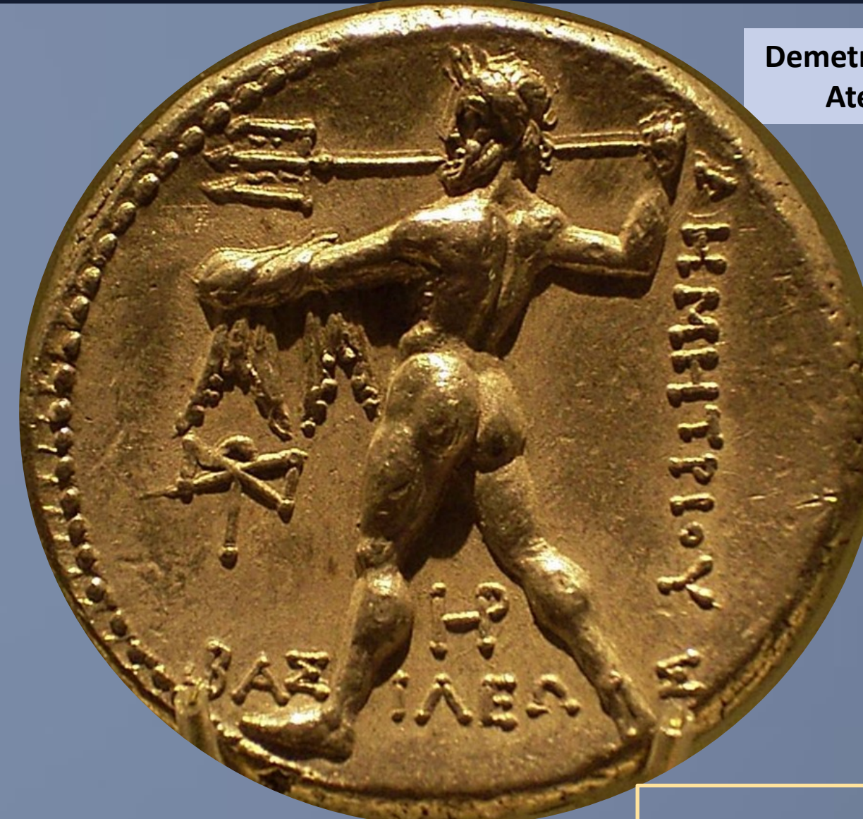
Demetrios Poliorcetes. Tetradracma de oro. De Atenas. Lisboa, Fundación Gulbenkian