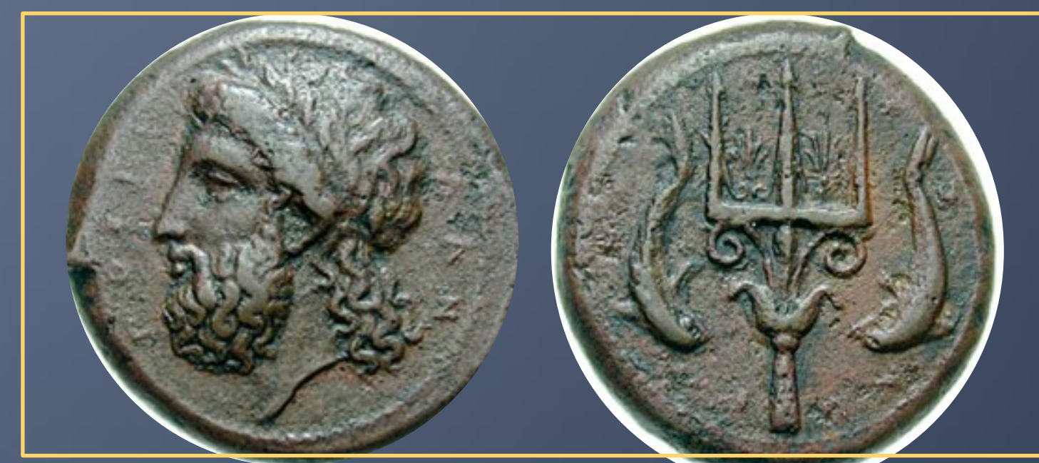
SICILIA, Mesina. Circa 338-331 a.C. Dilitron (nemidracma) Anverso: POSEI-DON, cabeza laureada de Posidón hacia la izquierda. Reverso: M-E-S-S-AN-IO-N, tridente flanqueado por dos delfines.