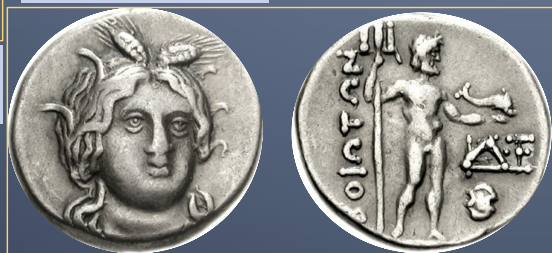
Moneda de la liga Beocia. Circa 250 a.C. Dracma de plata. Anverso: Cabeza de Deméter o Kore coronada de espigas. Reverso: Posidón estante, desnudo, sosteniendo tridente y delfín. Leyenda: Boioton. Monograma y escudo de Beocia