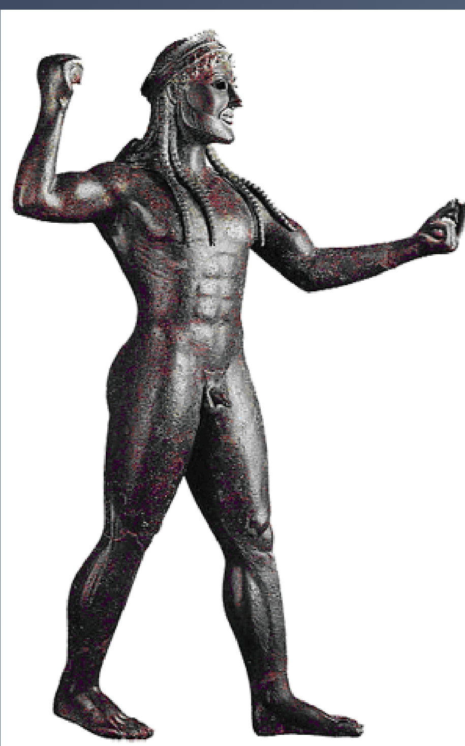
Posidón (o Zeus de Ugento). S. VI a.C. Bronce. Museo Nacional de Tarento