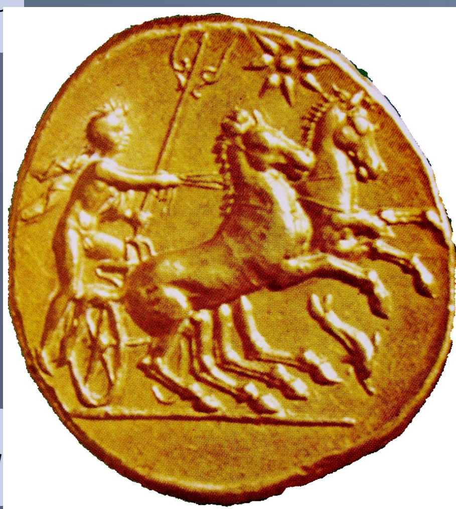
Statera de Tarento. Posidón conduciendo una biga. Circa Museo Británico