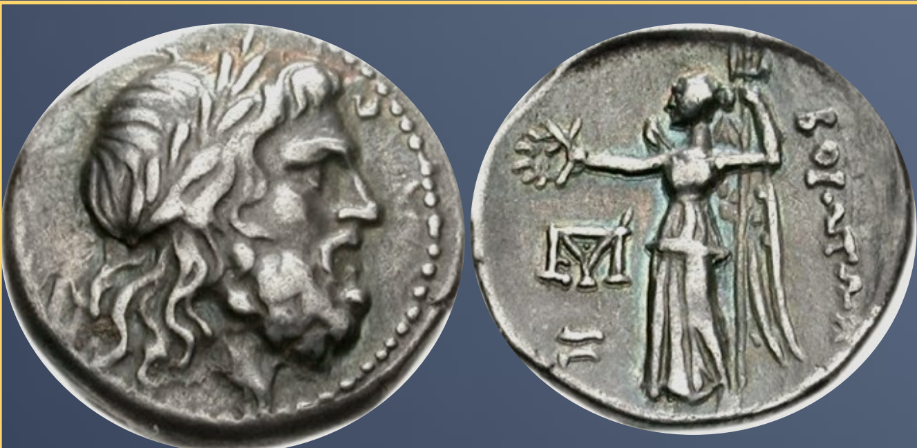
Moneda de la liga de Beocia . Circa 225-171 a.C. Dracma de plata. Anverso: cabeza laureada de Posidón hacia la derecha. Reverso: Niké de pie sosteniendo tridente y corona, hacia la izquierda. Leyenda: Boioton. Monograma de Beocia