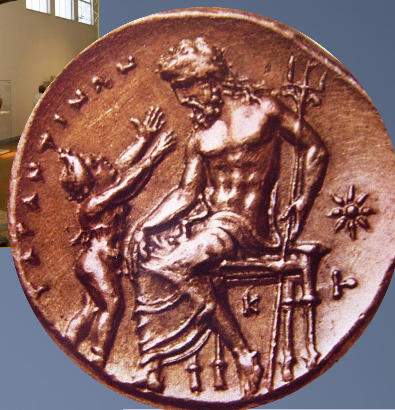
Statera de oro de Tarento. Primera mitad del siglo IV a.C. Leyenda: Tarantinon Taras niño y Posidón. Museo Británico.