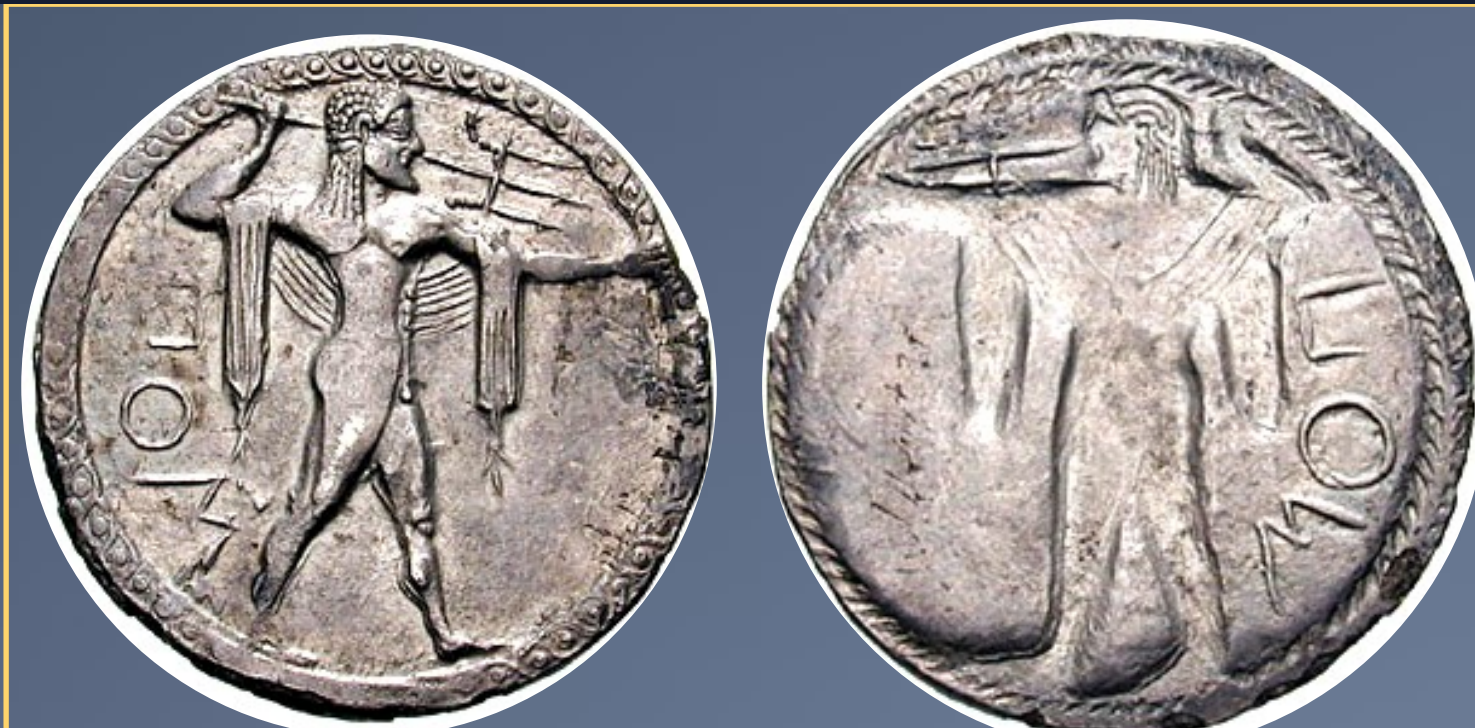
LUCANIA . 530-500 a.C. Statera de plata (6.08 gm). Leyenda: POS