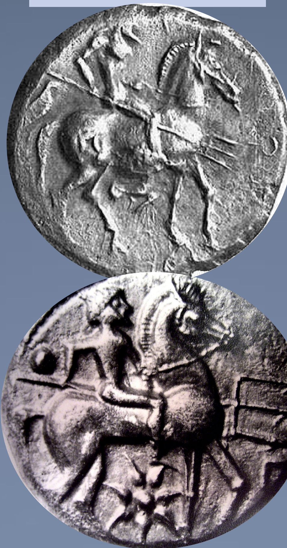
Potidaia. AR-Tetradracma. (17.40 g), c. 500-480 a.C. Posidón Hippios. Rev.cuadrado incuso.