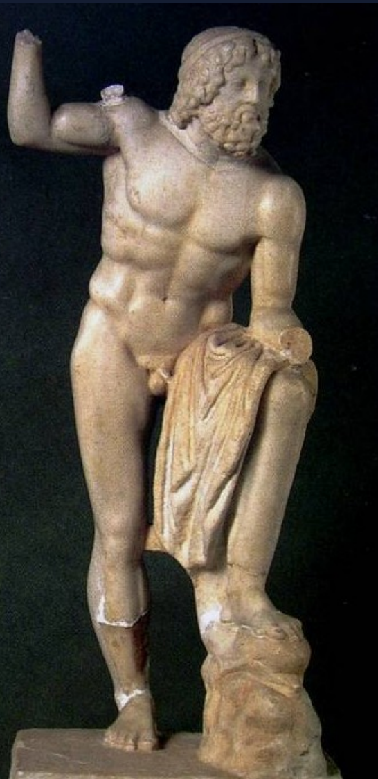
Posidón de Eleusis . S. IV a.C. Museo Nacional de Atenas