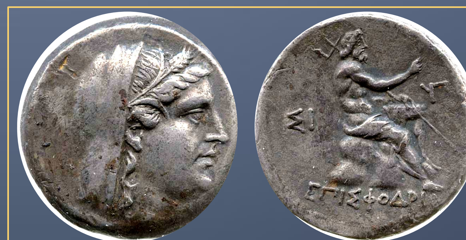
Deméter y Posidón: Tetradracma procedente de Byzantium. 250-219 a.C. Anverso: Cabeza de Deméter velada con corona de espigas en su cabello. Reverso: Posidón sentado sobre una roca con tridente y aplustrum . LEYENDA :By. En exergo: EPI SFODRIA