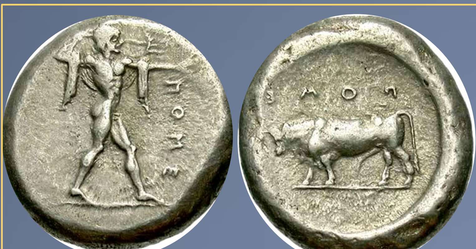
Lucania-Posidonia, Statera de plata, c.470-450 a.C. Leyenda: POSE, directa en el anverso y regrógrada en el reverso. 8.12 gr.