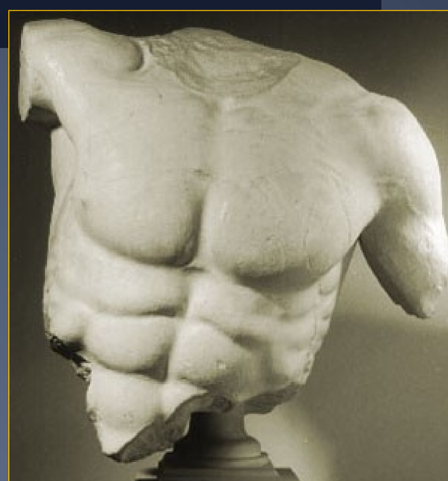
Torso de Posidón del Partenón. Museo de la Acrópolis, Atenas